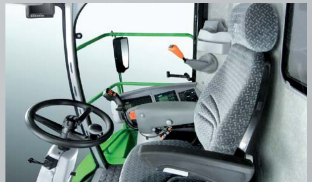
Современная кабина с новой панелью управления и рулевой колонкой, регулируемой в трех плоскостях.