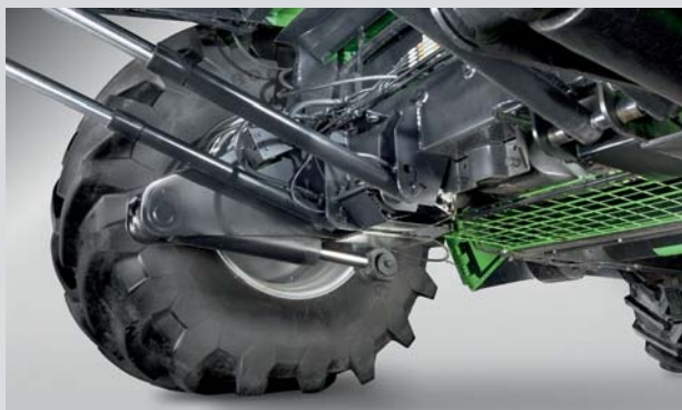
Благодаря системе Balance, комбайны DEUTZ-FAHR сохраняют уровень производительности даже при уборке на наклонной местности.